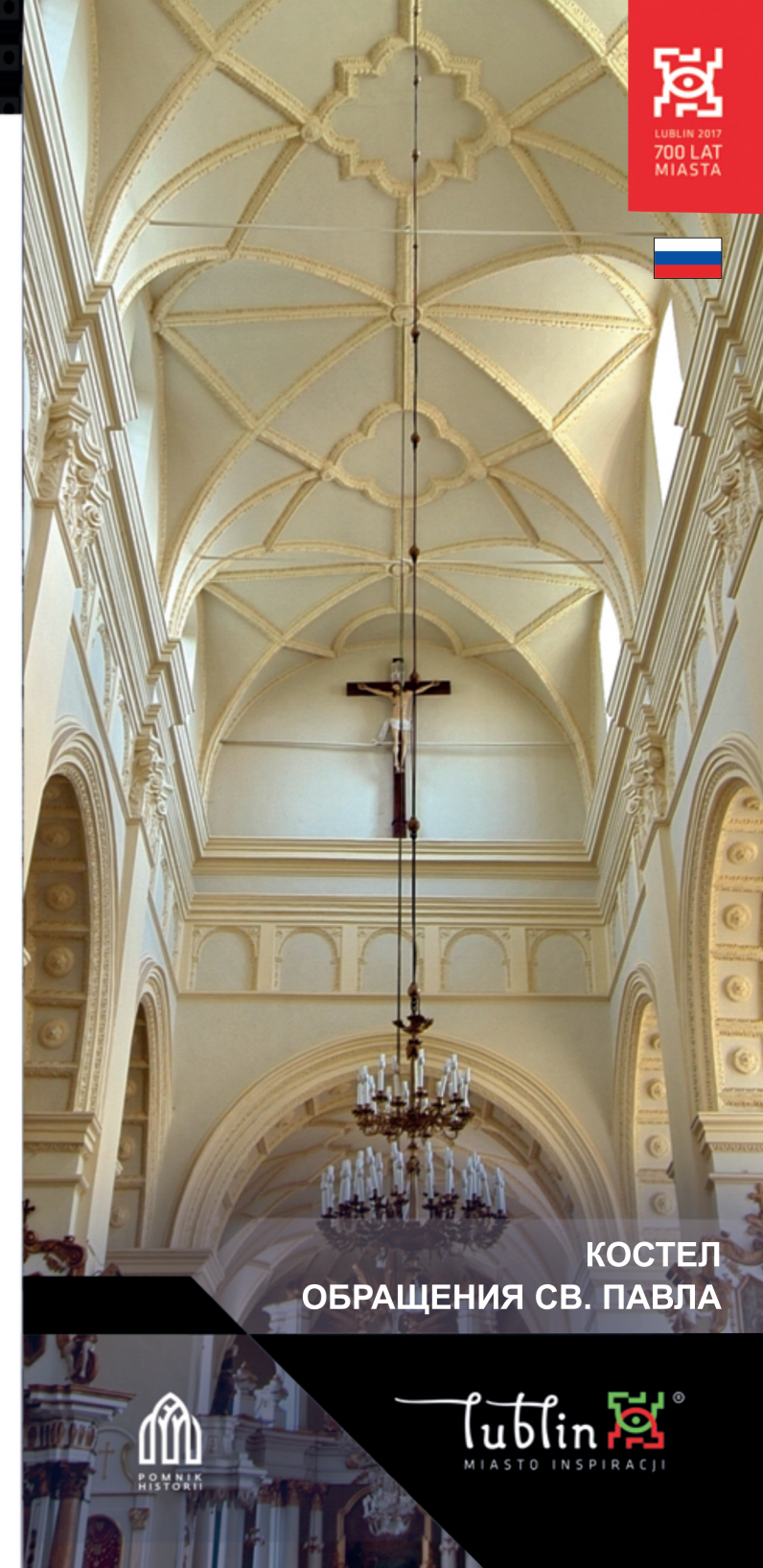
КОСТЕЛ ОБРАЩЕНИЯ СВ. ПАВЛА

Сансовиновская поза – тип изображения, созданный итальянским скульптором Андреа Сансовино; в скульптуре представление покойного в позе сна или отдыха – лежащим свободно на боку, с корпусом подпертым рукой, согнутой в локте, со скрещенными ногами.