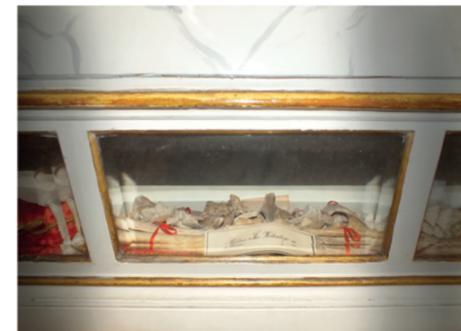
Мощи св. Валентина

В левом боковом нефу алтари: св. Франциска Ассизского, св. Яна из Дукли, св. Анны и Иисуса Милосердного, который первоначально носил имя св. Феклы. В северной части храма находится часовня Угровецких с двумя алтарями: Богородицы Ченстоховской и св. Феклы. Деревянный амвон украшен барочной скульптурой с изображением св. Франциска и Евангелистов. В центральном нефу стоят ренессансные скамьи и исповедальни.