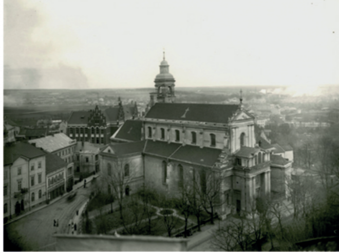
Фотография межвоенного периода.

Предположительно, в готическое время костел бернардинцев был трехнефным залом , с пресвитерием замкнутым прямой стеной или с трех сторон. Костел был короче настоящего на одну арку с западной стороны.