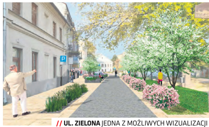
/// UL. ZIELONA JEDNA Z MOŻLIWYCH WIZUALIZACJI

– To nasza odpowiedź na prośby mieszkańców, rad dzielnic oraz przedsiębiorców prowadzących na tym obszarze działalność gospodar-