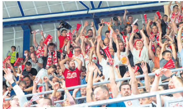
// KOSZYKÓWKA CIESZY SIĘ DUŻYM ZAINTERESOWANIEM