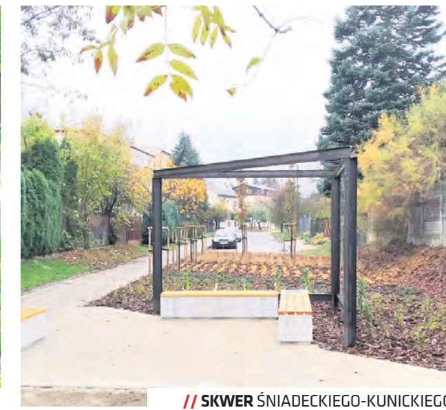
// SKWER ŚNIADECKIEGO-KUNICKIEGO