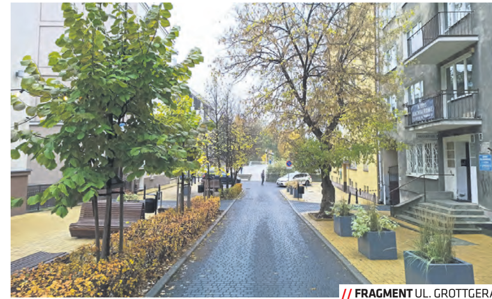
// FRAGMENT UL. GROTTGERA

Edycje tematyczne to nie jedyna zmiana w formule Zielonego Budżetu. W trakcie naboru mieszkańcy nie muszą już składać gotowych projektów, wystarczy, że wskażą działkę miejską, maksymalnie