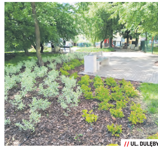
// UL. DULĘBY