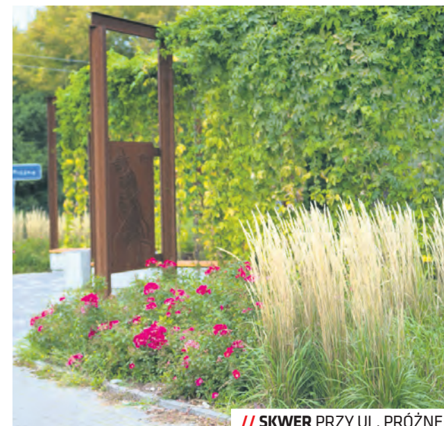
// SKWER PRZY UL. PRÓŻNEJ

Szczegółowych informacji na temat zasad w edycji Zielonego Budżetu udziela Biuro Miejskiego Architekta Zieleni (tel. 81 466 26 86, maz@lublin.eu) oraz Biuro Partycypacji Społecznej (zielony@lublin.eu).