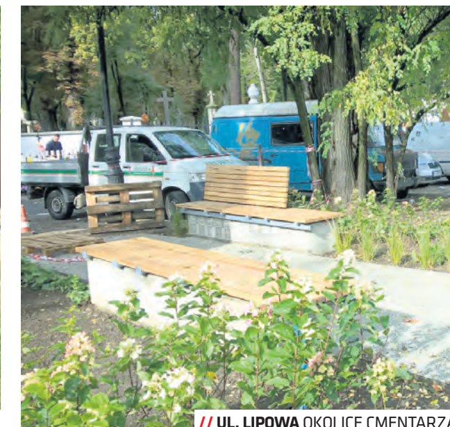
// UL. LIPOWA OKOLICE CMENTARZA