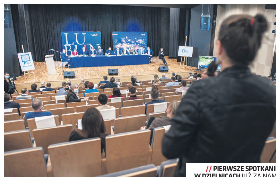
/// PIERWSZE SPOTKANIE W DZIELNICACH JUŻ ZA NAM!

Efektem szeregu spotkań będzie „Plan dla Dzielnic”, czyli opis priorytetów rozwojowych w konkretnej dzielnicy w perspektywie najbliższych lat. Następnym etapem jest odzwierciedlenie w decyzjach dotyczących kształtu budżetu miasta, w wieloletniej prognozie finansowej oraz podczas starań o dofinansowanie projektów ze środków unijnych. Pozwoli to na