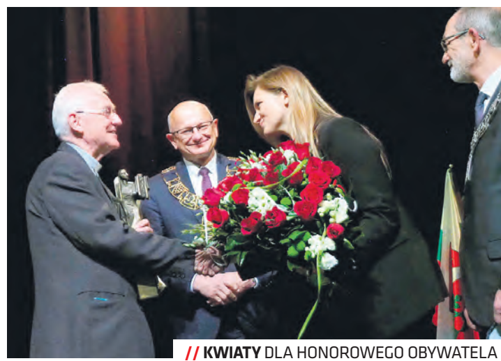
/// KWIATY DLA HONOROWEGO OBYWATELA