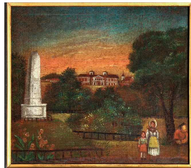
Автор неизвестен, памятник Люблинской унии, 2-ая четверть XIX в., Люблинский музей.

Европейская комиссия решением от 10 марта 2015 г. (Законодательный Вестник ЕК, 2015/C83/0) присвоила городу Люблин знак Европейского наследия, как месту заключения Люблинской унии – исключительный символ мирной и демократической интеграции двух стран, с сосуществовавшими на их территории разными исповеданиями и нациями.