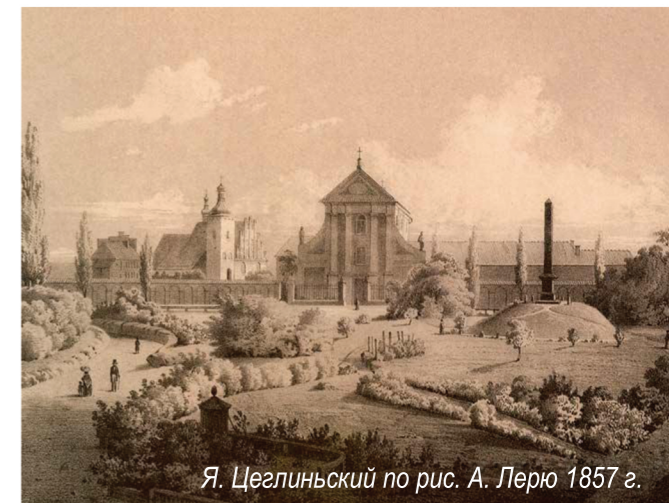
Я. Цеглиньский по рис. А. Лерю 1857 г.

Эти идеи материально представлены в форме сохранившихся в пространстве города Люблина памятников – свидетелей заключения Унии и ее увековечивающих: часовни Святой Троицы в Люблинском замке, костела св. Станислава Епископа и Мученика и монастыря оо. доминиканцев.