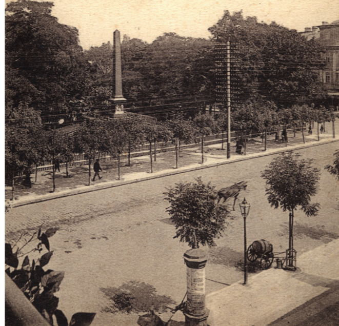
Фотография 1916 г.

пришли в упадок, поэтому монахи переселились в монастырь реформантов на ул. Бернардинскую 15. В 1819 г. наместник Польского Герцогства, генерал Юзеф Зайончек выдал приказ о разборке монастыря и костела, дав объяснение, что "став опустевшим и с царапинами, годится к сносу". Предположительно, во время сноса стены в 1820 г. был уничтожен также обелиск. Памятник был опрокинут и разбит на куски вместе с каменными скульптурами, Юзеф Доманьский председатель Комиссии люблинского воеводства, выдавший решение о разборке, покрывлся позором.