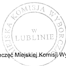
(pieczęć Miejskiej Komisji Wyborczej)