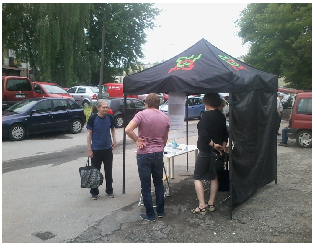
Punkt konsultacyjny ul. Łąbedzia