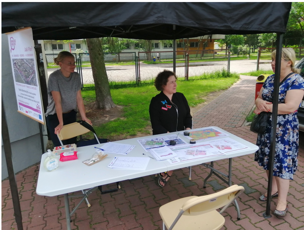
Punkt konsultacyjny rejon ul. Jesiennej