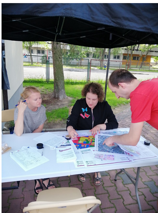
Punkt konsultacyjny rejon ul. Jesiennej